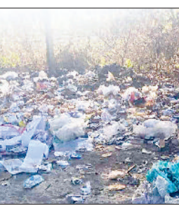
पीर बाबा के पीछे लगा कूड़े का ढेर।

के कारण सोमवार को सुबह कर्मचारियों दिनभर मशकत करने के बाद भी पूरे कचरे को उठा पाते हैं।