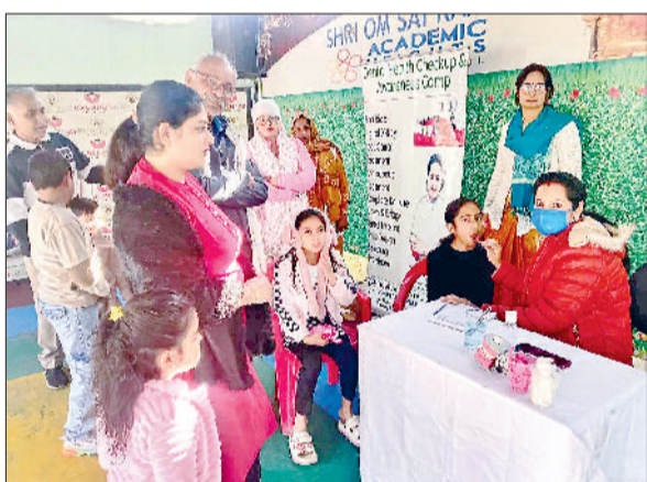
महेन्द्रगढ़। शिविर में मौजूद चिकित्सक।