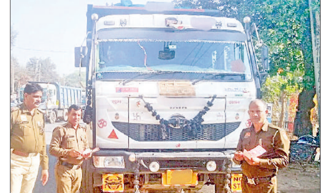
नारनौल। वाहनों पर रिपलेक्टर लगाते पुलिसकर्मी।