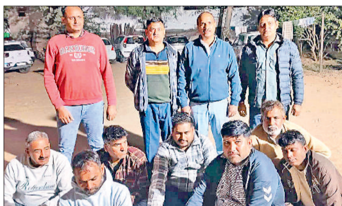
महेंद्रगढ़। पुलिस गिरफ्त में आरोपित।