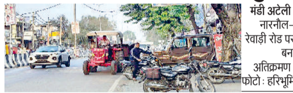
मंडी अटेली। नारनौल-रेवाड़ी रोड पर बना अतिक्रमण।