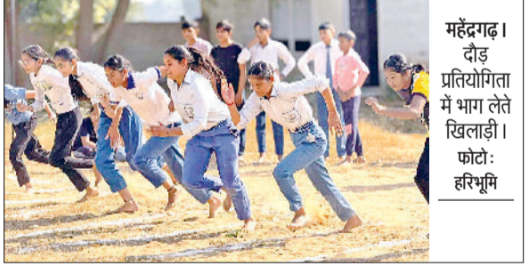
महेन्द्रगढ़। दौड़ प्रतियोगिता में भाग लेते खिलाड़ी।

दोबारा से शुरुवात कर दी गई है, जिनमें से एक प्रमुख कार्य अटेली राजकीय महाविद्यालय में 4.52 करोड़ की लागत से मल्टीपुर्पज हॉल