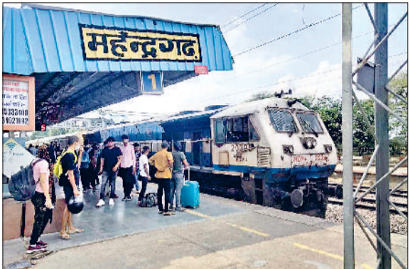
महेन्द्रगढ़। रेलवे स्टेशन महेंद्रगढ़।