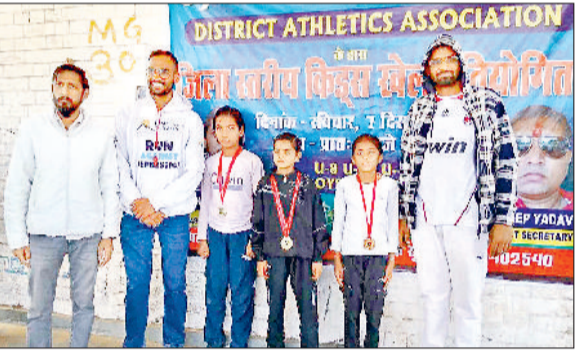
महेन्द्रगढ़। विजेता बच्चों को मेडल पहनाकर सम्मानित करते हुए।