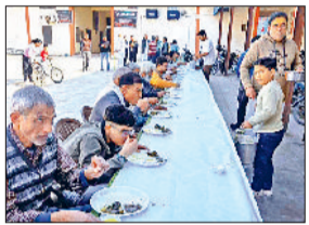
महेन्द्रगढ़। भंडारे में प्रसाद ग्रहण करते श्रद्धालु।