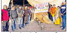
नारनौल। गोवंश के लिए सवामणी लगाते हुए।