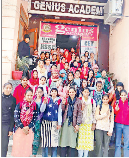
महेन्द्रगढ़। खुशी जाहिर करते विद्यार्थी।