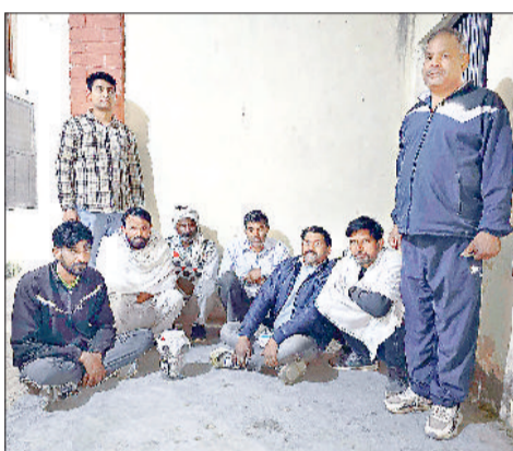
नारनौल। पुलिस गिरफ्त में आरोपित।